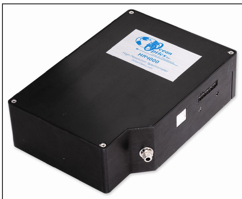
Внешний вид спектрометра HR4000

Спектрометры Ocean Optics соединяются с компьютером через порт USB. Модель HR4000 также позволяет использовать последовательный порт. При подключении по интерфейсу USB 2.0 или 1.1 спектрометр получает питание от компьютера и не требует внешнего источника питания.